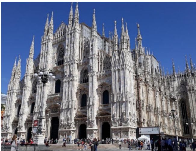
Dom zu Mailand

Sie sehen auf Ihrem Rundgang zwei weitere sehr bedeutende Kirchen, die beide die lange Geschichte und die religiöse Bedeutung der Stadt perfekt widerspiegeln.