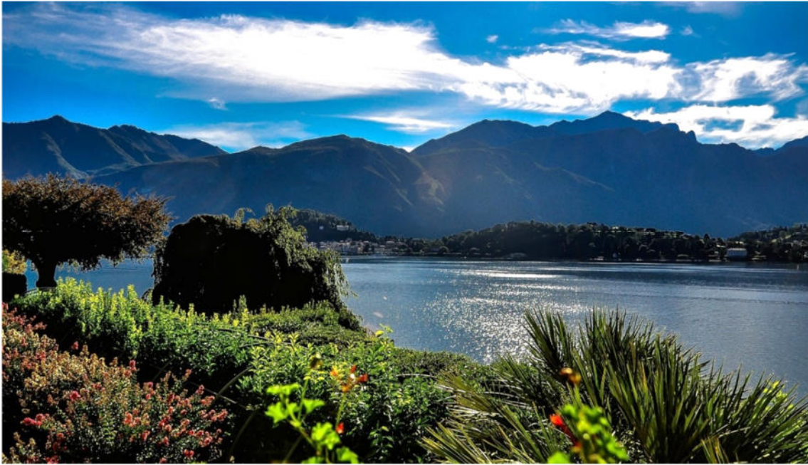
Comer See

Im Schutze des Alpenkamms, wo sich der raue Charme urwüchsiger Bergtäler mit der mediterranen Leichtigkeit italienischer Lebensart verbindet, erzählen römische und mittelalterliche Baukunst sowie der Formenreichtum von Renaissance und Barock von der langen und wechselvollen Geschichte einer von der Sonne verwöhnten Kulturregion.