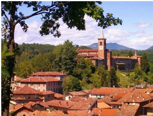
Castiglione Olona

Erstes Ziel Ihres heutigen Ausflugs ist das charmante kleine Dorf Castiglione Olona . Es liegt malerisch am Fuße der Alpen und ist bekannt für seine reiche Geschichte und atemberaubende Architektur. Eine der Hauptattraktionen ist die Stiftskirche Santi Stefano e Lorenzo , die für ihre wunderschönen Fresken, die von berühmten Künstlern der Renaissance geschaffen wurden, bekannt ist.