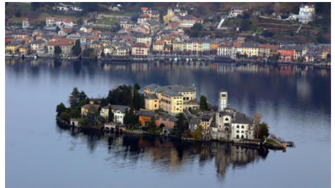
Insel San Giulio

Mit ihren engen, gepflasterten Gassen, historischen Gebäuden und der charmanten Piazza Motta zieht die kleine Stadt Orta San Giulio ihre Besucher in den Bann. Oberhalb des Ortes befindet sich der Sacro Monte di Orta , der ebenfalls zu den neun ausgezeichneten Sacri Monti Norditaliens gehört. Die Kapellen erzählen mit ihren Fresken und Skulpturen die Lebensgeschichte des Heiligen Franz von Assisi.