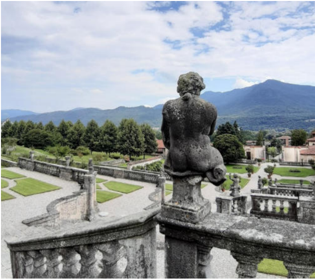
Villa della Porta Bozzolo CCBYSA4.0 Manna001 at-wikimedia.commons

Vom Seeufer aus erreichen Sie nach einer kurzen Fahrt ins Landesinnere das historische Zentrum von Casalzuigno . Mit der prächtigen Adelsresidenz Villa della Porta Bozzolo aus dem 16. Jh. besichtigen Sie eines der bedeutendsten Zeugnisse des Barocks in dieser Region. Der imposante Garten zählt zu den harmonischsten Meisterwerken der Gartenbaukunst und grüner Architektur des Landes.