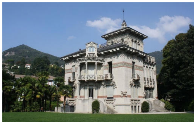
Villa Bernasconi in Cernobbio CCBYSA4.0 Dario Crespi at-wikimedia.commons

Zu Beginn fahren Sie in das Dorf Cernobbio , nahe der Schweizer Grenze. Hier besichtigen Sie mit der Villa Bernasconi ein wahres Kleinod des italienischen Jugendstils. Sie wurde Anfang des 20. Jh. erbaut und zählt zu den eindrucksvollsten Villen dieser Epoche in der Region. Mit geschwungenen Formen, floralen Dekorationen, detailreichen Ausgestaltungen und auch schmiedeeisernen Elementen schuf der Architekt ein wahres Meisterwerk , das sich durch die Nähe zum Comer See und die umliegende Landschaft perfekt in die Umgebung einfügt.