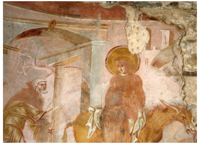
Fresko in der Kirche Santa Maria Foris Portas in Castelseprio

Am Rand des archäologischen Parks befindet sich auch das ehemalige Benediktinerinnenkloster von Torba aus dem 8. Jh. Hier, inmitten der malerischen Natur und der eindrucksvollen lombardischen Landschaft, werden Sie zu einem gemeinsamen Mittagessen erwartet.