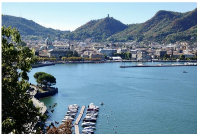
Como CCBYSA4.0 Uppa66 at-wikimedia.commons

Mit diesen herrlichen Eindrücken kehren Sie zum Hotel zurück und genießen das gemeinsame Abendessen.