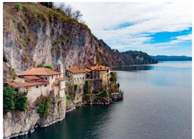
Santa Caterina del Sasso

Am Ostufer des Sees liegt die Einsiedelei Santa Caterina del Sasso , die im 13. Jh. mit großer Kunstfertigkeit in eine Felswand gebaut wurde und heute von der Franziskanischen Gemeinschaft von Betanien geführt wird. Sie besichtigen das Kloster , von dessen Lage und Mythos seiner Entstehung eine faszinierende Wirkung ausgeht.